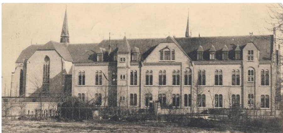
Het westelijke aanzicht van het klooster is vrijwel onveranderd gebleven.

Dat het terrein van de Gemeentewerf een overgangsfunctie zou moeten hebben is nogal gezocht en in feite geconstrueerd zonder dat daar een duidelijke stedenbouwkundige onderbouwing aan ten grondslag ligt. Het creëren van een kunstmatige overgang in hoogte legt geen stedenbouwkundige relatie. Integendeel, de oorspronkelijke sterke contrastwerking wordt hiermee opgeheven.